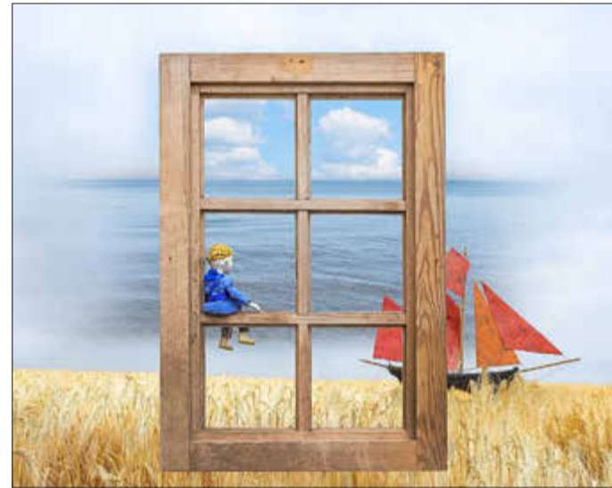
Caspar Guck in die Welt - Kindertheater

28.9. 19.30 Uhr Ganna Gryniva Konzert zur Interkulturellen Woche, in Zusammenarbeit mit der Integrationsbeauftragten durchgeführt