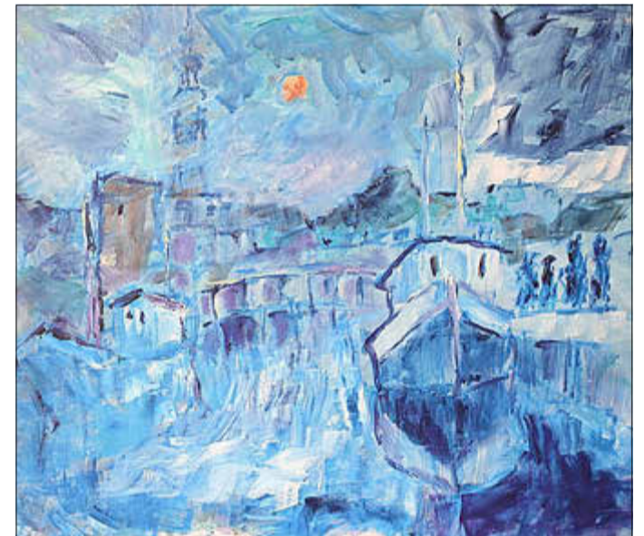
Manfred Prinz - Hafen im Nebel

einem über 70 Jahre entstandenen grafischen und malerischen Werk. Die Ausstellung ist mittwochs bis samstags von 15 - 18 Uhr vom 25. September bis 26. Oktober in der Feldstraße 20 zu besichtigen.