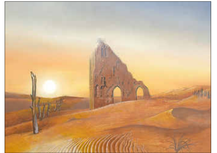
Günter Fritz Klosterruine Eldena in den Wanderdünen

30 Künstler vom Pommerschen Künstlerbund haben in einem Workshop ihre besten Werke zu diesem Thema ausgewählt und zeigen sie am 13. Juli an zwei Ausstellungsstellen in Greifswald. Die Vernissage im PKB KunstLADEN in der Feldstraße 20 wird wie immer um 15 Uhr eröffnet, diesmal zu Ehren des großen Sohnes der Stadt in besonders festlicher Form. Am gleichen Tag um 18 Uhr wird mit einem Orgel-Solo der