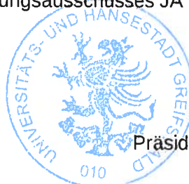
Egbert Liskow Präsident der Bürgerschaft