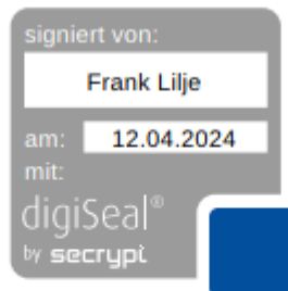
F. Lilje Wirtschaftsprüfer